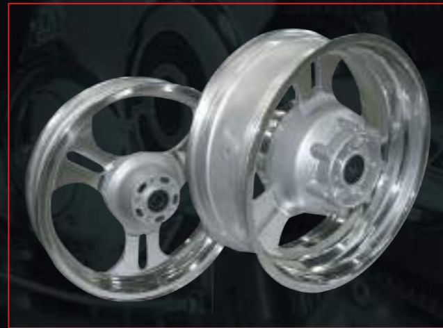
KAWASAKI VN 1500/1600 von orig. 5.00"x17" verbr. auf 6.50"x17"