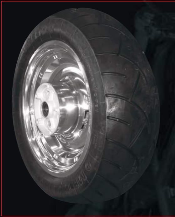
Oben und rechts: KAWASAKI VN 900 von orig. 4.50"x15" verbr. auf 6.00"x16"