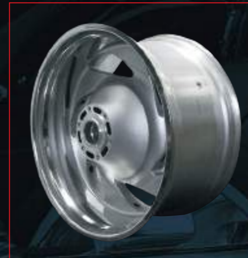
SUZUKI VZR (M) 1800 von orig. 8.00"x18" verbr. auf 10.00"x18"