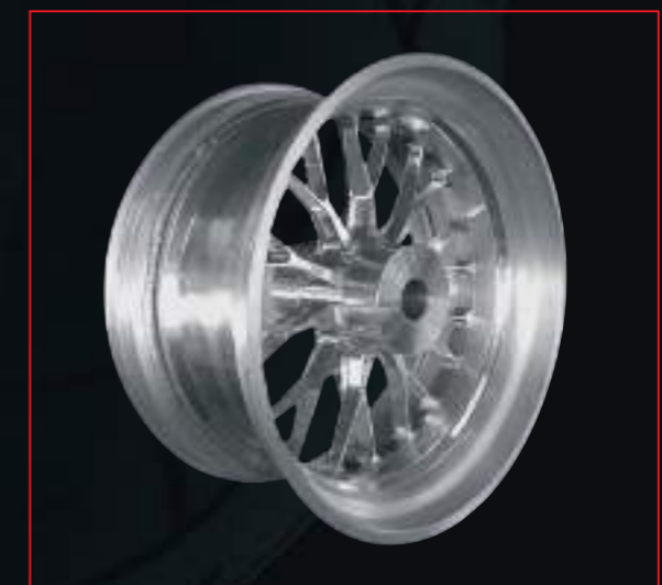
Schmiederad von orig. 5.75"x16.5" verbr. auf 10.00"x18"