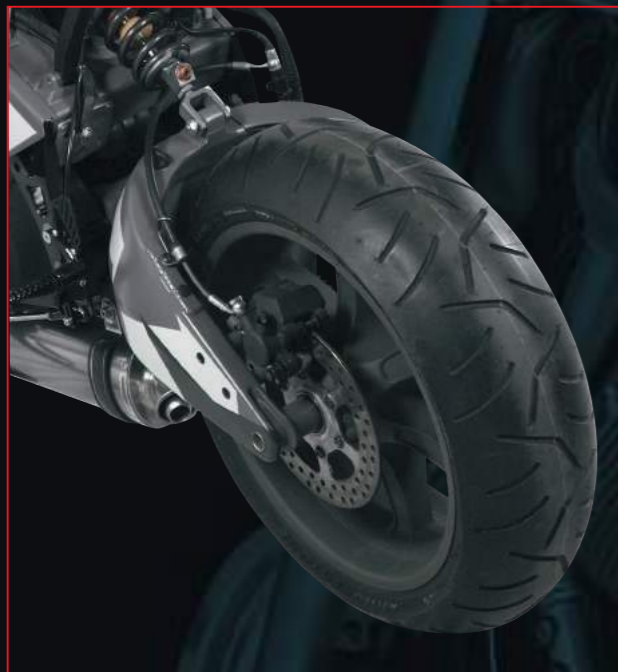
BUELL von orig. 5.50"x17" verbr. auf 7.00"x17"