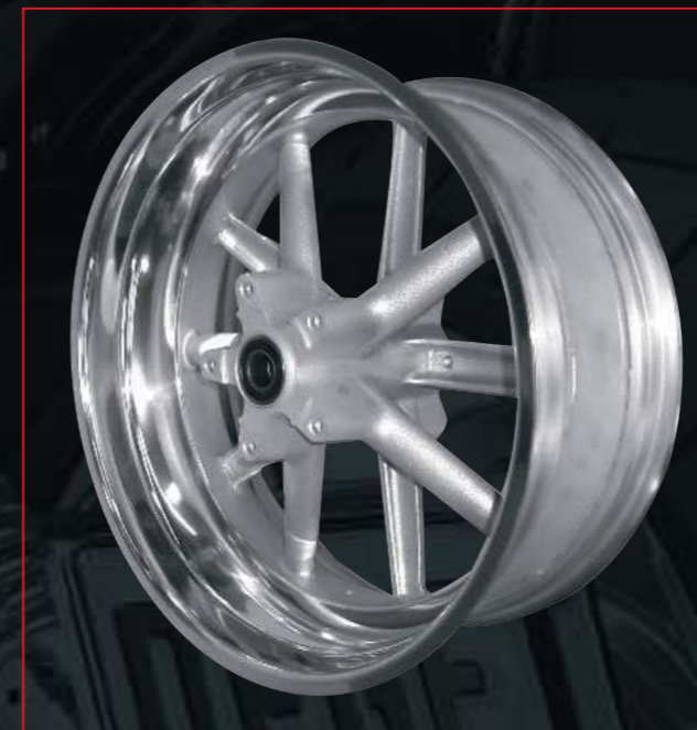
HARLEY DAVIDSON STREET ROD von orig. 5.50"x18" verbr. auf 7.50"x18"

Wir freuen uns auf Ihren Anruf - verbindliche, sachkompetente Auskunft garantiert.