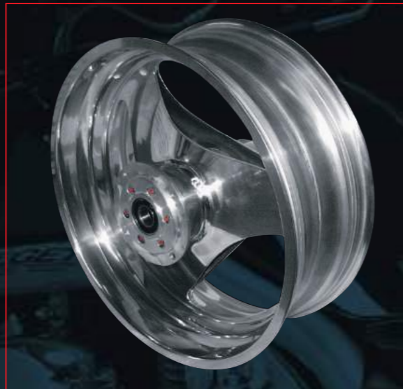
BUELL PM RAD von orig. 5.50"x17" verbr. auf 6.50"x17"