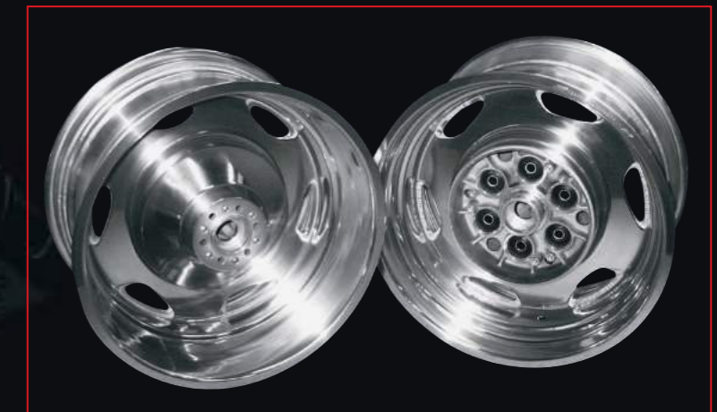
SUZUKI VL 1500 von orig. 5.00"x15" verbr. auf 9.00"x16"