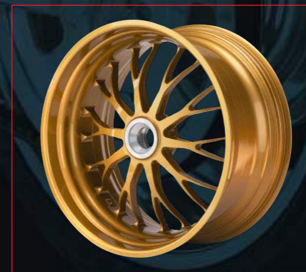
Schmiederad für Einarmschwinge von orig. 6.00"x17" verbr. auf 9.00"x18"