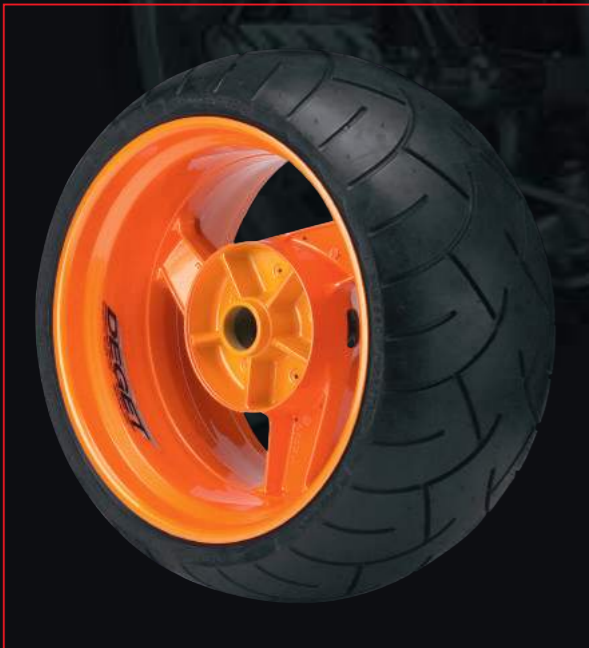
KAWASAKI ZZR 1100 von orig. 5.50"x17" verbr. auf 10.00"x18"

In diesem Prospekt finden Sie Beispiele für Serienradverbreiterungen. Da der Umfang unserer Möglichkeiten Räder zu verbreitern um ein vielfaches größer ist, werden wir auch für Sie und Ihr Motorrad eine interessante Lösung anbieten können.