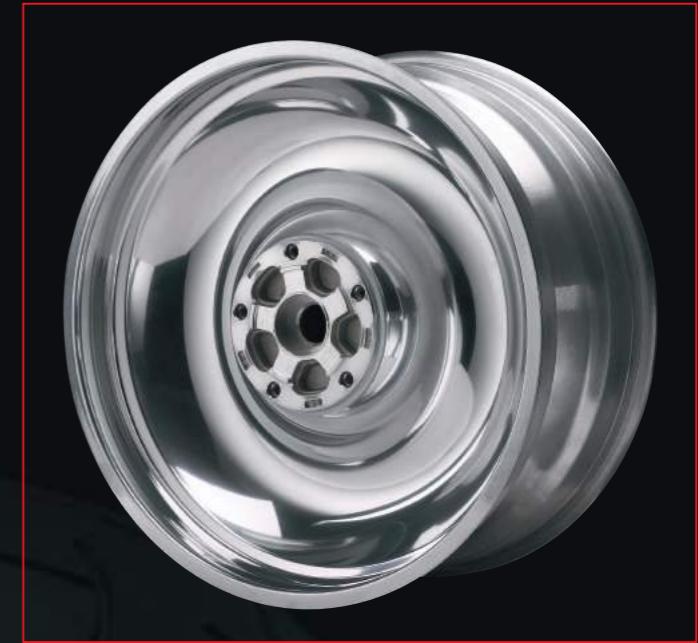
HARLEY DAVIDSON V-ROD von orig. 5.50"x18" verbr. auf 8.00"x18"