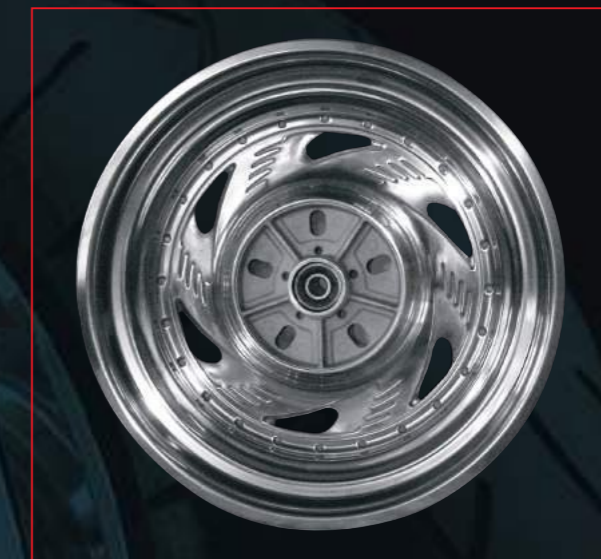
SUZUKI VZ 800 von orig. 3.50"x15" verbr. auf 6.00"x17"